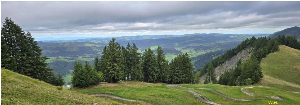
Sicht Richtung Entlebuch mit Mountain-Bike-Trail