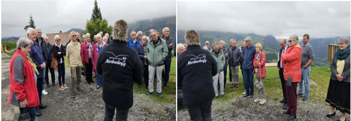
Die Leiterin des Berggasthauses erklärte den Besuchern nach dem Essen das Tourismuskonzept der Marbachegg.

Später - draussen auf dem Vorplatz - erläuterte die Managerin des Bergrestaurants das interessante und ausgeklügelte „Marbacher Tourismus-Konzept“. Dieses zielt darauf ab, einen ganzjährigen Besucherstrom zu generieren, um die teure Infrastruktur unterhalten und finanzieren zu können. So hält die Marbachegg vor allem den jüngeren Gästen neben einem vielversprechenden Wandergebiet auch besondere sportliche Aktivitäten bereit, wie z.B. Mountain-Bike-Trails, Fahrten auf der spektakulären Carts-Bahn, Gleitschirmschule und natürlich viele Wintersportmöglichkeiten.